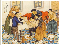
明治初年愛知県公立病院外科手術の図