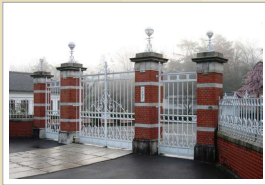
博物館明治村正門(旧第八高等学校正門)